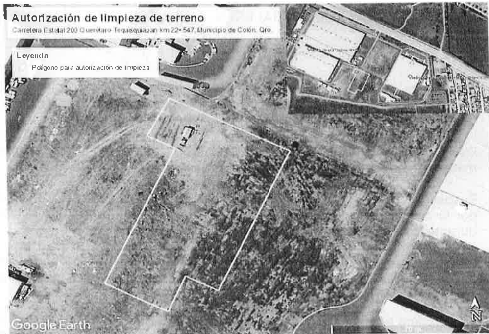
Imagen 1. Ubicación espacial del predio.

SEGUNDO.- PROYECTOS AEROESPACIALES, S. DE R.L. DE C.V., manifiesta que la información proporcionada es verdadera, en caso de incurrir en falsedad, esta consiente de las sanciones que en el ámbito civil, penal y demás sean aplicables por la autoridad competente.